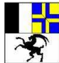
Grosser Rat Chur