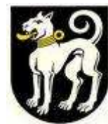
Gemeinde Ermatingen TG